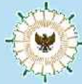
Asosiasi Pemerintah Kabupaten Seluruh Indonesia (APKASI)